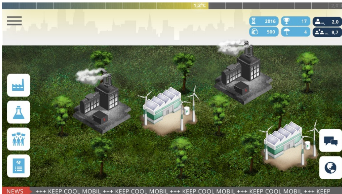
Der Stadtscreen zeigt die wirtschaftliche Lage der eigenen Stadt und mögliche Spielaktionen

Als Bürgermeister*in einer Stadt stehen den Spielenden verschiedene Spielaktionen zu Verfügung, um die Entwicklung der eigenen Stadt zu bestimmen und Siegpunkte zu bekommen.